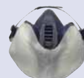
3M™ 400 Prefiltr, który chroni przed zatkanie filtra aerozolem lakieru