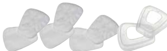
Filtry przeciwpyłowe 3M™ serii 5000 z EN143:2000