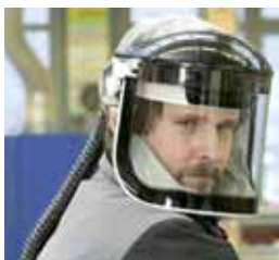
Systemy z wymuszonym przepływem powietrza