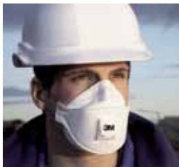
Jednorazowe półmaski filtrujące