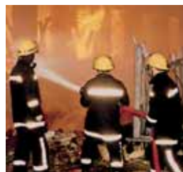
Materiały odblaskowe Scotchlite™