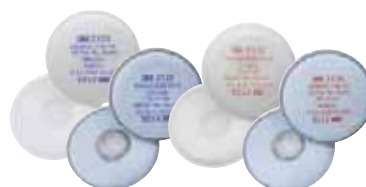
Filtry przeciwpyłowe 3M™ serii 2000 z EN143:2000

Maski oddechowe 3M zapewniają bezpieczeństwo i zwiększają wydajność pracy.