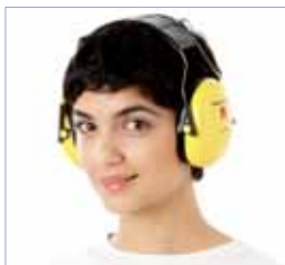
Wkładki i nauszniki przeciwhałasowe