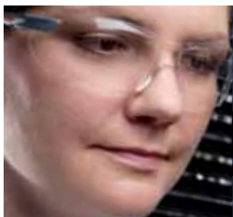
Okulary i gogle ochronne