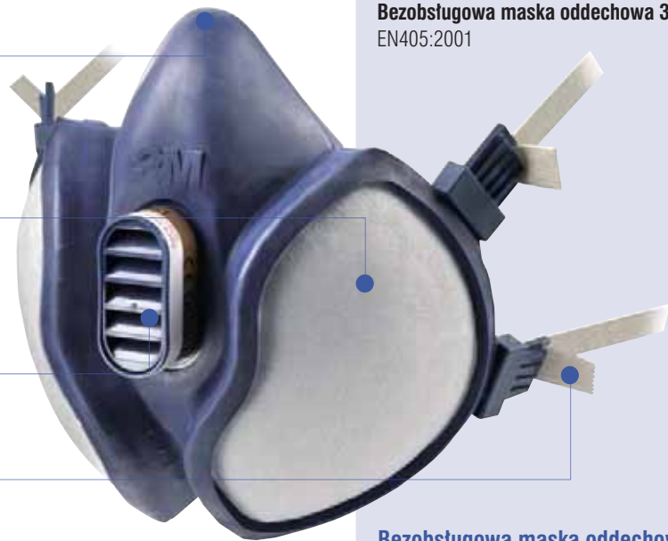
Bezobstługowa maska oddechowa 3M™ 4251 EN405:2001