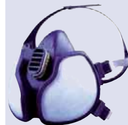
3M™ 4251 Maska oddechowa chroniąca przed parami organicznymi i cząstkami FFA1P2D