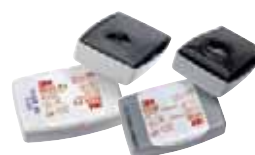
Filtry przeciwpyłowe 3M™ serii 6036/6038 z EN143:2000