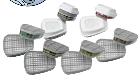
Pochłaniacze przeciw gazom i parom serii 3M™ 6000