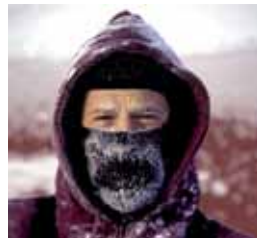
Włókny ocieplające Thinsulate™